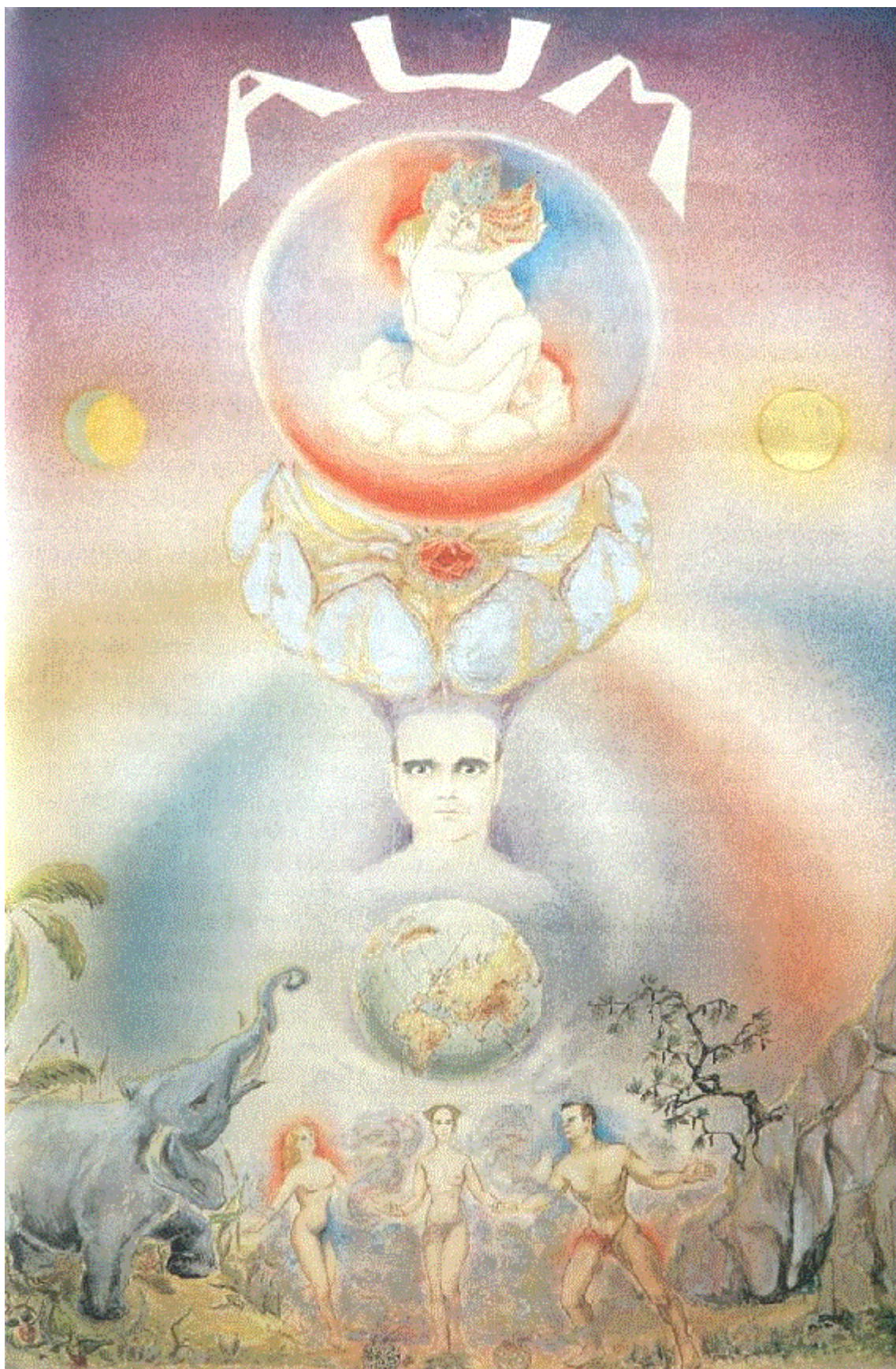
OBRAZ MÁGA PRVNÍ TAROTOVA KARTA